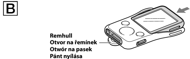
Remhull Otvor na řemínek Otwór na pasek Pánt nyílása